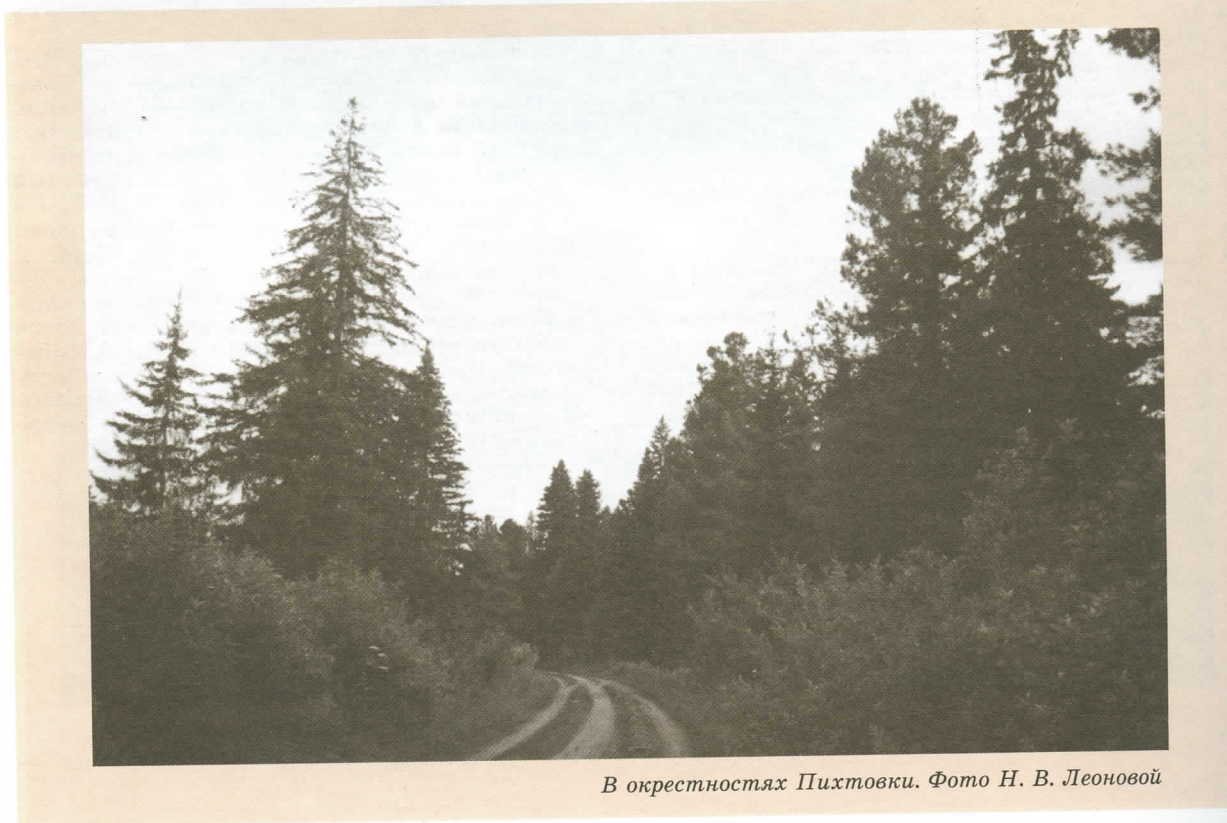
В окрестностях Пихтовки.