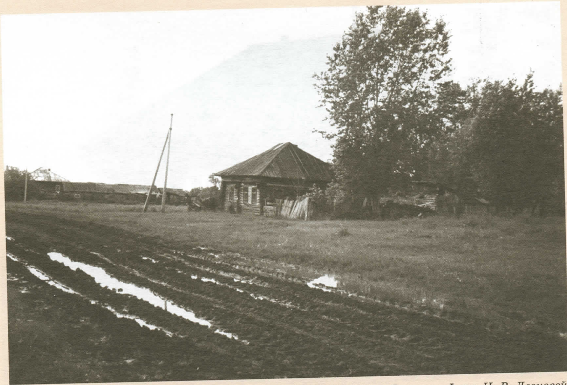
Деревня Мальчиха после дождя. Дорога на Ершовку.